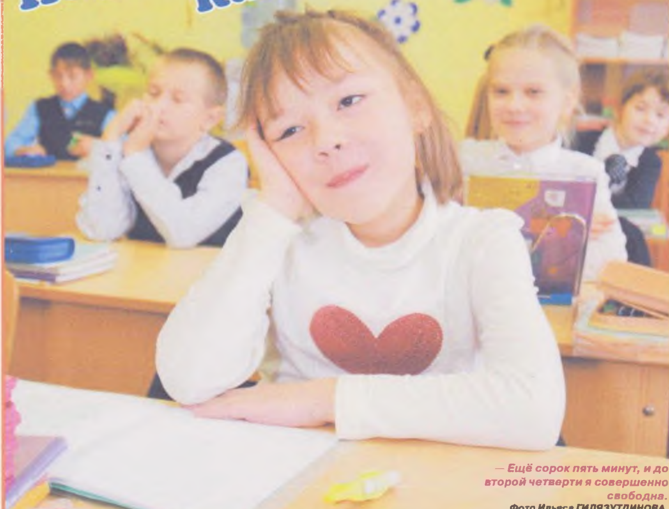
— Ещё сорок пять минут, и до второй четверти я совершенно свободна.